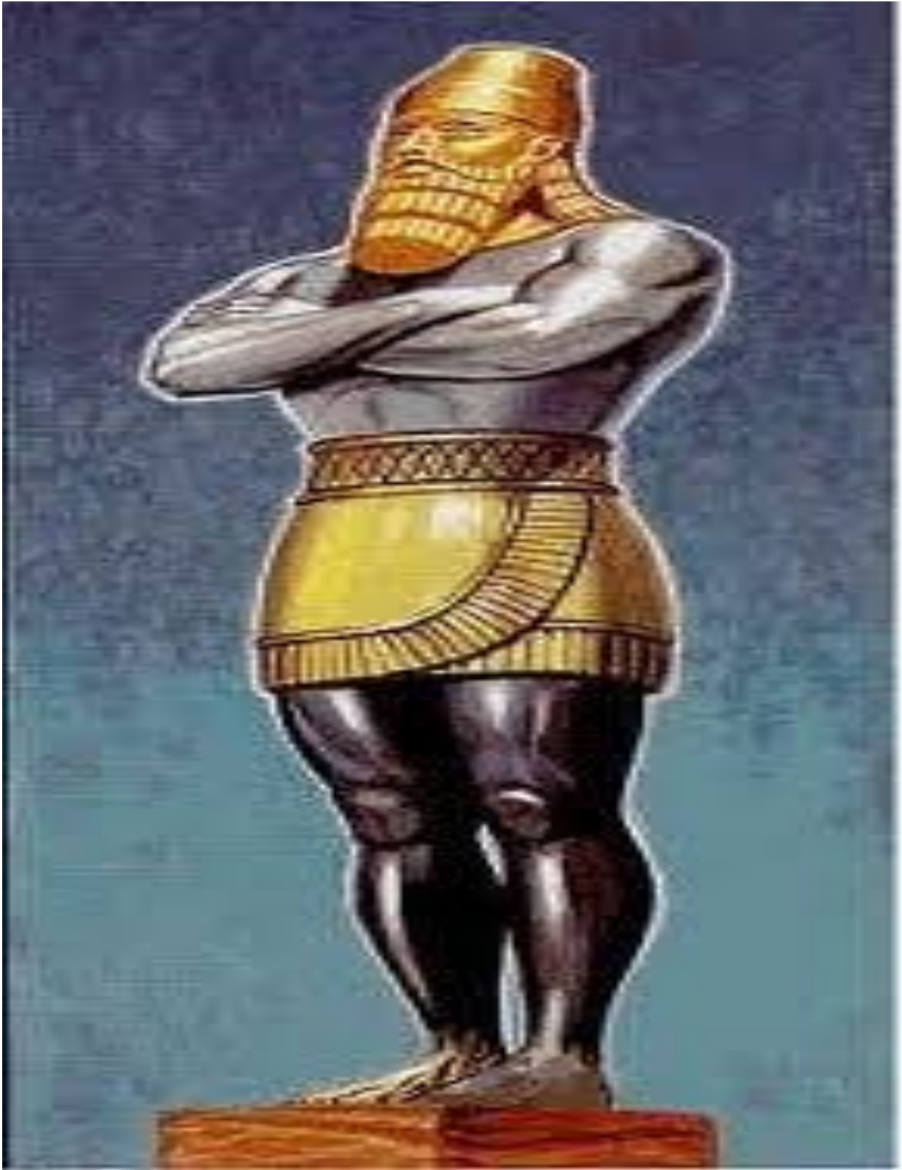
Sesili N. Rayiti